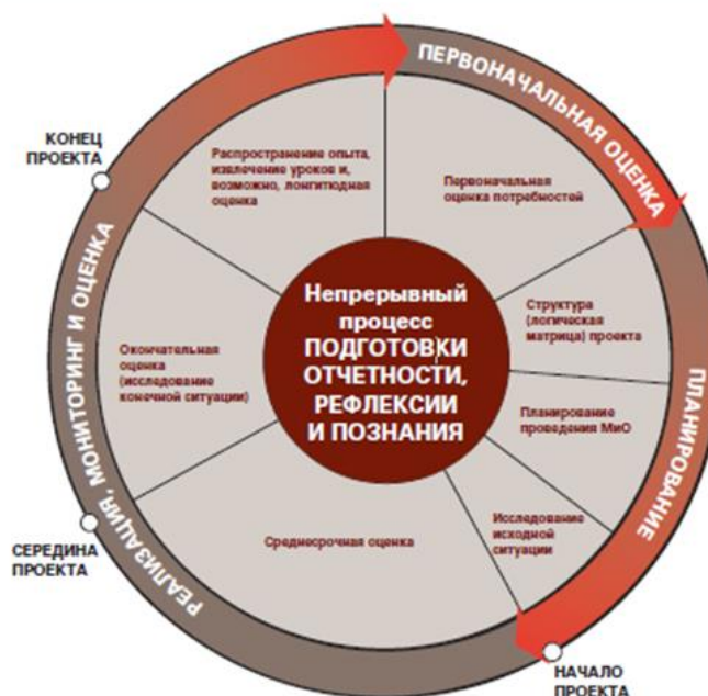
ДИАГРАММА 1: Основные мероприятия по МиО в рамках жизненного цикла проекта/программы*